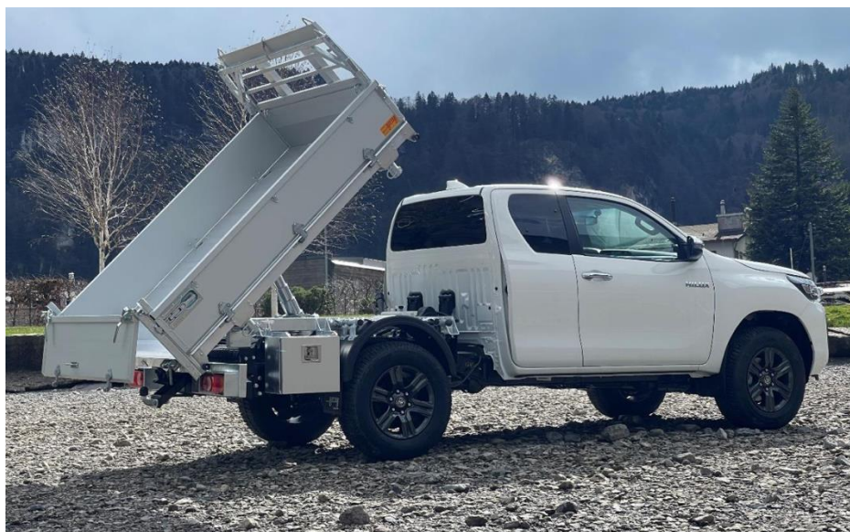
Exemple de JEEP avec pont basculant

L'évolution des missions de l'édilité et l'engagement nécessaire d'un employé supplémentaire à l'édilité nécessitent l'achat d'un nouveau véhicule de type JEEP équipée d'un pont basculant permettant d'exercer toutes les missions qui lui sont dévolues.